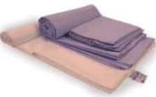
W177 TYYNYLIINA, 350 x 400 mm

Kangas SL2, 50 % puuvilla / 50 % polyesteri. Väri valkoinen, keltainen tai sininen. Täyte karstattua polyesteriontelokuituvanaa. Peitteet kestävät laitospesun 60 °C.