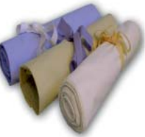
W178 ALUSLAKANA, 1200 x 1700 mm

Kangas 70 % puuvilla, 30 % polyesteri. Väri valkoinen, keltainen tai sininen. Tyynyliinat kestävät laitospesun 60 °C.