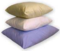
W175 TYYNY, 350 x 400 mm

Kangas SL2, 50 % puuvilla, 50 % polyesteri. Väri valkoinen, keltainen tai sininen. Täyte paakkuuntumaton polyesteripallokuituvanu. Tyynyt kestävät laitospesun 60 °C.