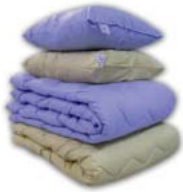
W176 PEITTO, 800 x 1200 mm

Kangas SL2, 50 % puuvilla, 50 % polyesteri. Väri valkoinen, keltainen tai sininen. Täyte paakkuuntumaton polyesteripallokuituvanu. Tyynyt kestävät laitospesun 60 °C.