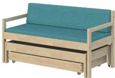
S501 + S505 + S506 VUODESOHVA

Hygieniapäällinen on nestettä läpäisemätöntä, hengittävää ja allergiaystävällistä kangasta, jonka toinen puoli on muovitettu polyuretaanilla. Pesu 90 °C. Kankaat ÖKÖ-TEX 100 standardin mukaisia.